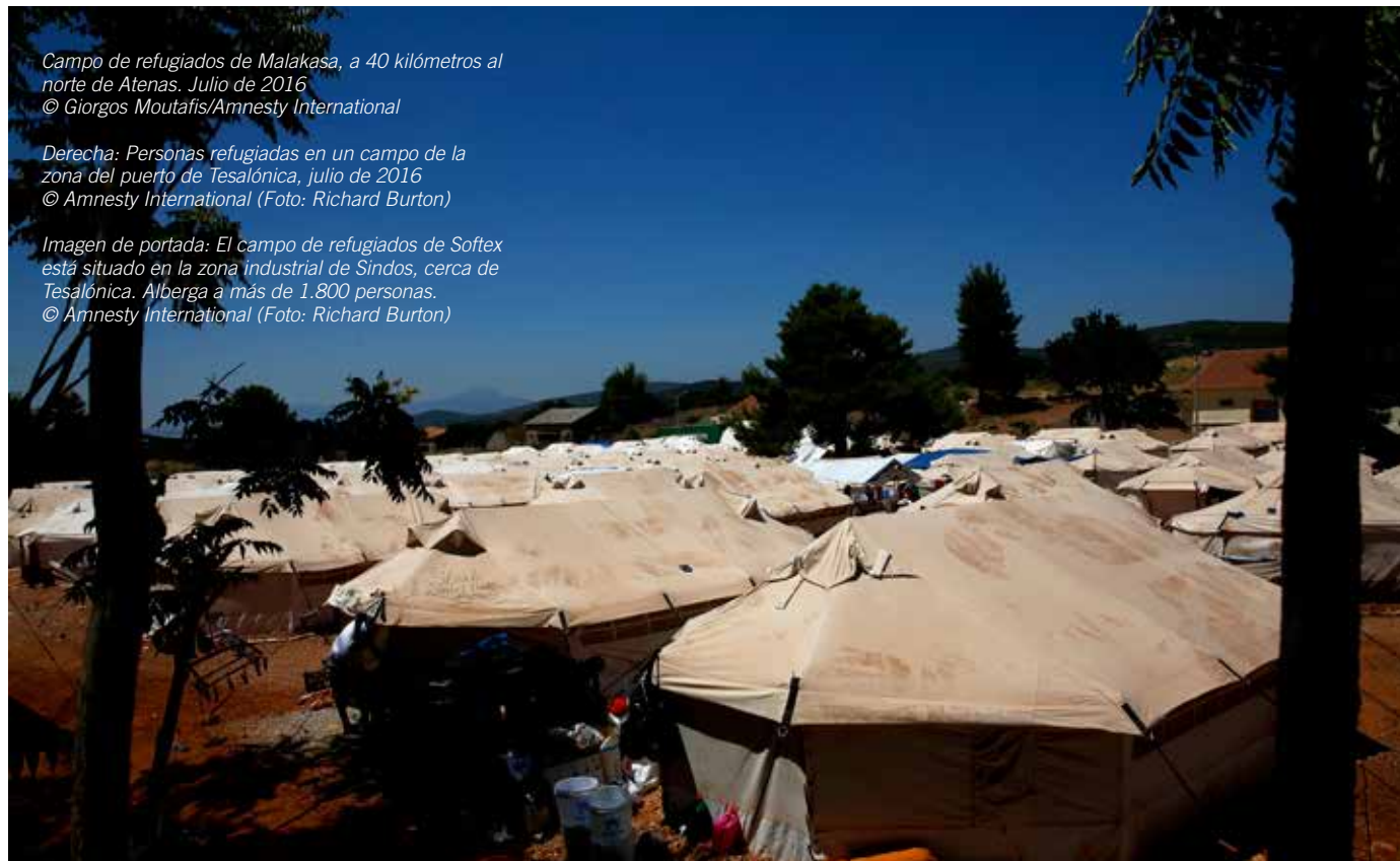
Imagen de portada: El campo de refugiados de Softex está situado en la zona industrial de Sindos, cerca de Tesalónica. Alberga a más de 1.800 personas. © Amnesty International (Foto: Richard Burton)

Derecha: Personas refugiadas en un campo de la zona del puerto de Tesalónica, julio de 2016 © Amnesty International (Foto: Richard Burton)