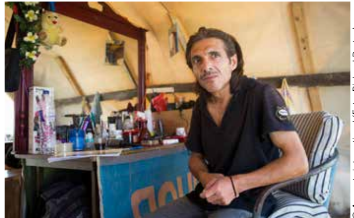
© Amnesty International (Foto: Richard Burton)

Las ONG, el voluntariado y los activistas han intentado paliar ciertas carencias de ayuda humanitaria, pero la inmensa mayoría de los campos oficiales de refugiados (consistentes, en general, en tiendas de campaña o almacenes reconvertidos) no son adecuados ni siquiera para estancias cortas. Las personas refugiadas entrevistadas por Amnistía Internacional se refirieron repetidamente, a la escasez de atención médica, de instalaciones sanitarias y de agua potable.