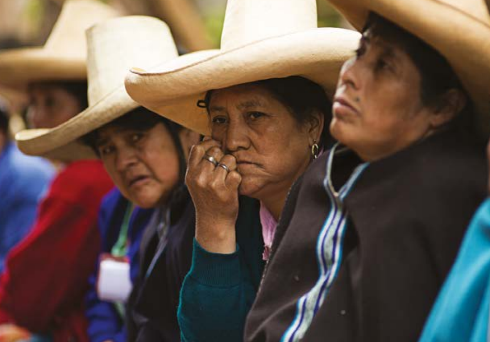
Reunión de la Asociación de Mujeres de Huancabamba para debatir acerca de las esterilizaciones forzadas, Huancabamba, Perú, octubre de 2015.

Chile es uno de los siete países de la región (junto con El Salvador, Haití, Honduras, Nicaragua, Surinam y República Dominicana) que penaliza el aborto en todos los supuestos. La prohibición total crea un entorno en que se impide a los profesionales de la salud responder de forma apropiada a las necesidades médicas de las mujeres y las niñas embarazadas.