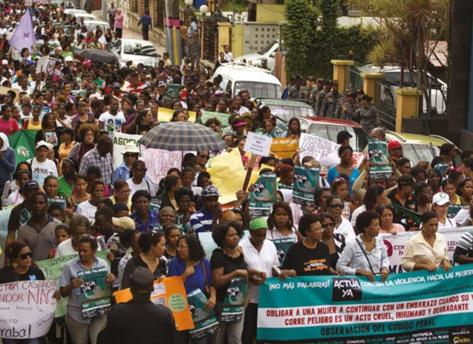
Manifestación para conmemorar el Día Internacional de la Eliminación de la Violencia contra la Mujer, Santo Domingo, República Dominicana, 25 de noviembre de 2015.