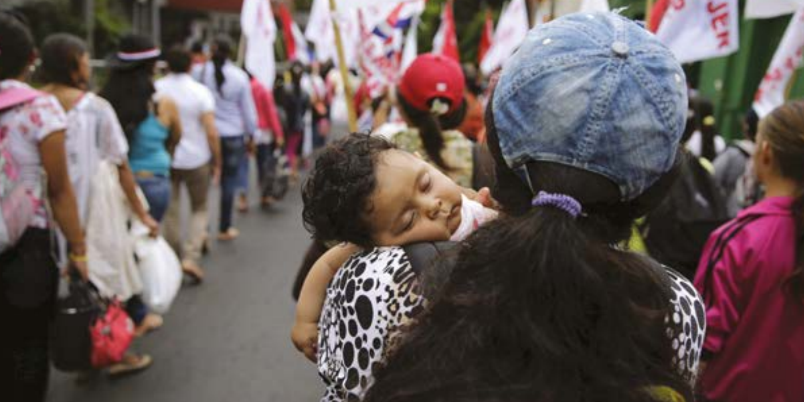
Manifestación para conmemorar el Día Internacional de la Eliminación de la Violencia contra la Mujer, Asunción, Paraguay, 25 de noviembre de 2015.

Estado, “la mortalidad materna es frecuentemente subestimada debido a deficiencias en la certificación médica de la causa de muerte en el Informe Estadístico de Defunción”, por lo que incluso sus cifras oficiales no representan el total de mujeres y niñas que han perdido la vida.