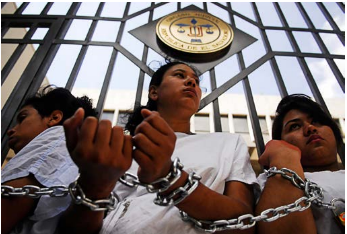
Activistas por los derechos de la mujer protestan frente a la Corte Suprema para exigir la despenalización del aborto, San Salvador, El Salvador, 15 de mayo de 2013.

“Me dolió, porque es una cicatriz que voy a llevar toda mi vida, no fue una decisión que naciera de mí, me la hicieron a la fuerza.”