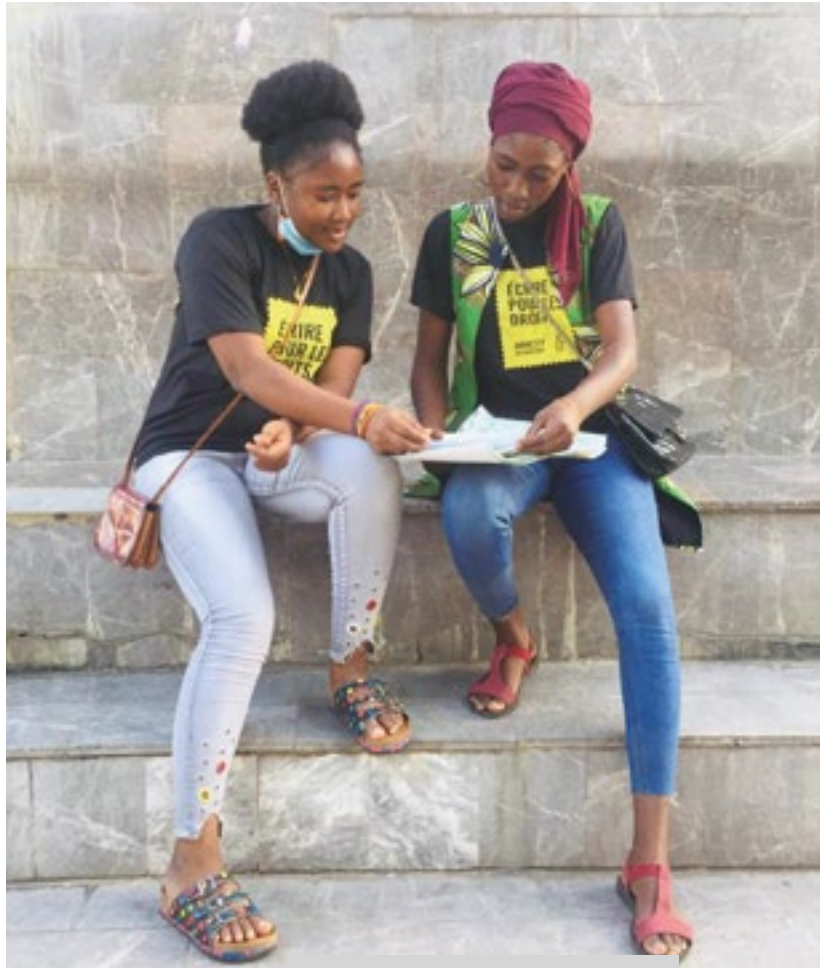
Evento de envío de cartas de Amnistía Internacional Benín, diciembre de 2020.

Los derechos humanos no son artículos de lujo para disfrutarlos sólo cuando las circunstancias lo permitan.