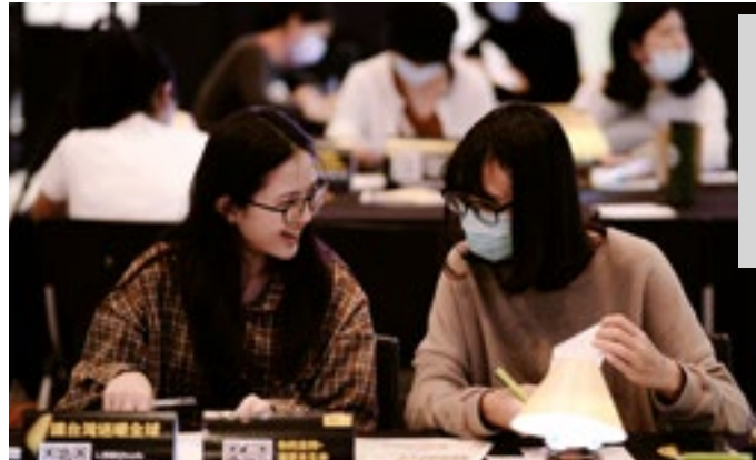
Evento de envío de cartas de Amnistía Internacional Taiwán, diciembre de 2020.

Además de las acciones de envío de cartas, Amnistía también habla con quienes tienen en su mano el poder de cambiar la situación de esas personas, como por